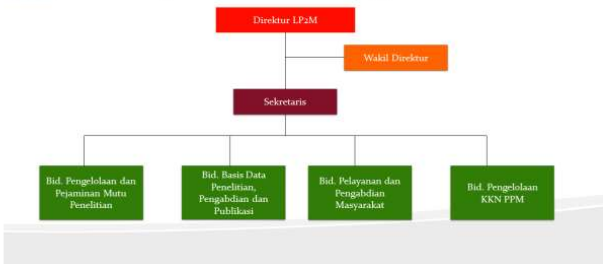
Struktur Organisasi LP2M STIE Yasa Anggana